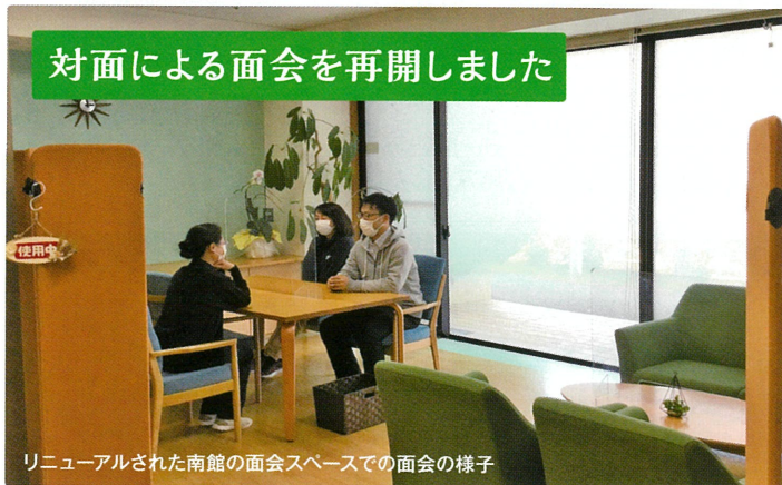
リニューアルされた南館の面会スペースでの面会の様子