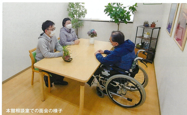
本館相談室での面会の様子

3月より対面による面会を再開しました。南館は玄関ロビーをリニューアルし、面会スペースとしてご利用いただけるようになりました。 ご入居者様とご家族様が、大切なひと時を過ごされております。